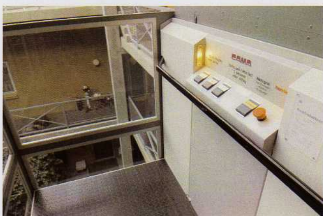
Eksempel med glasskakt