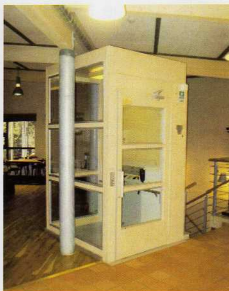
Lift med høj dør ved øverste stop