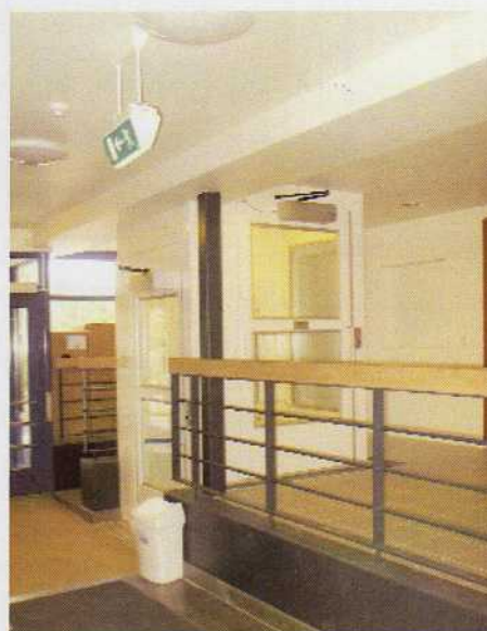
Lift med lille niveauforskel