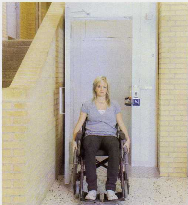
Mulighed for automatisk døråbning