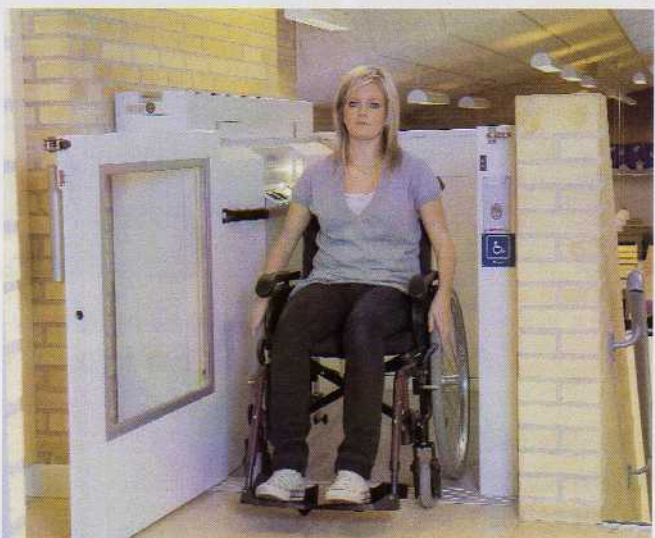
Bevægelsesfrihed er livskvalitet

Cama lodretlift er enkel at installere i eksisterende byggeri og kræver kun få bygningsændringer.